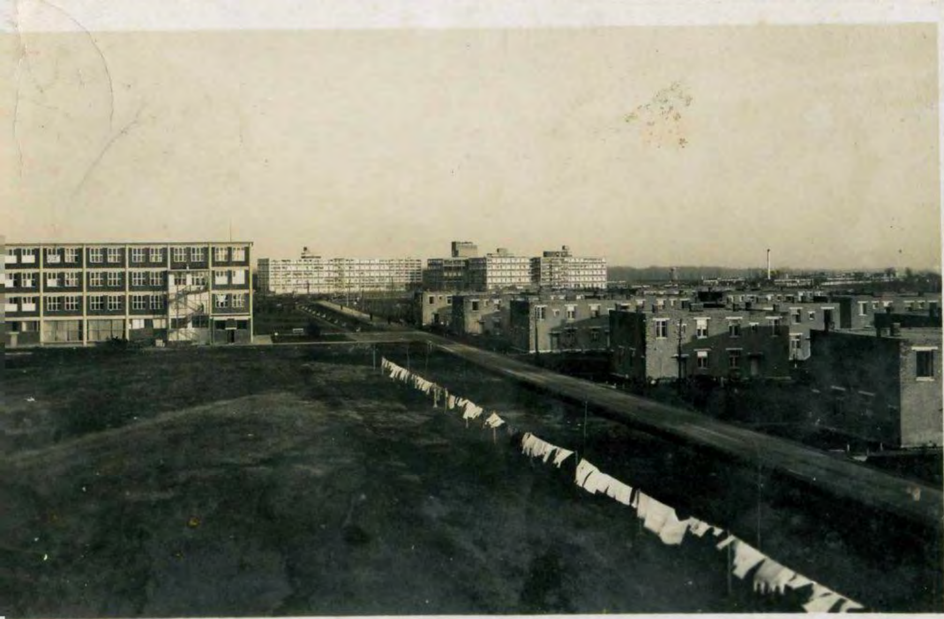
Borovo – Juhoslávia 1934,