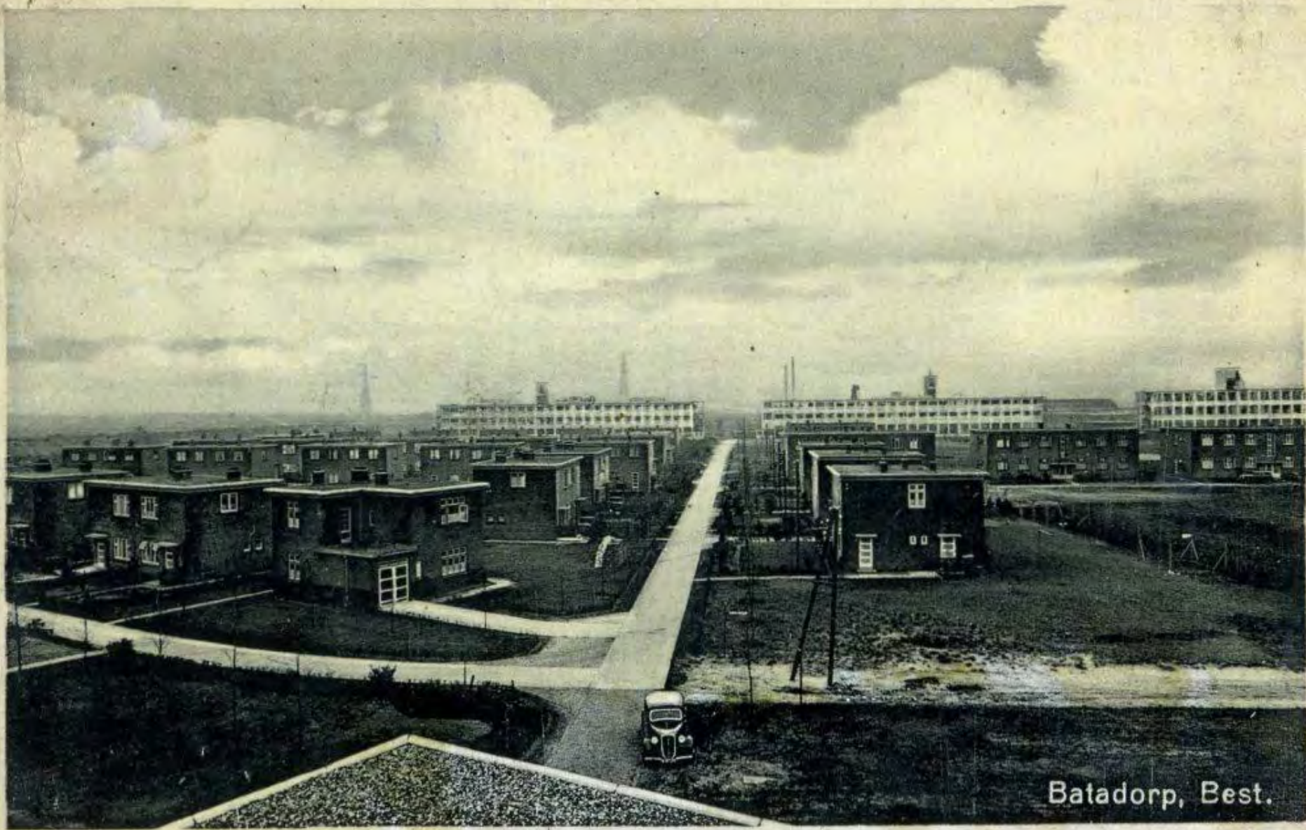
Best Batadorp Holandské kráľovstvo 1934 - 1941