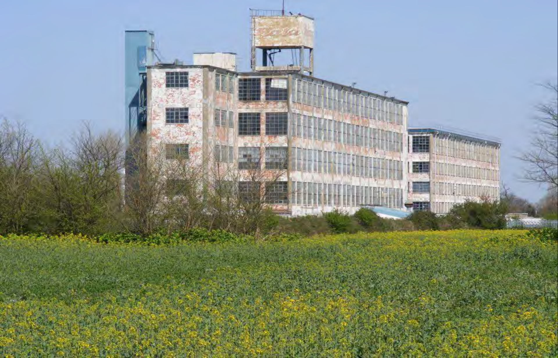
East Tilbury Spojené kráľovstvo Veľkej Británie a Severného Írska 1933 – 1941 Bata Avenue v East Tilbury