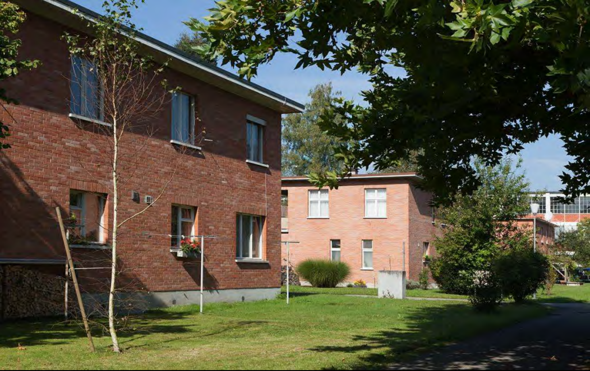
Typické červené domy nájdeme aj vo Švajčiarsku, Möhling - Švajčiarska federácia 1932 - 1936, 1942 - 1948