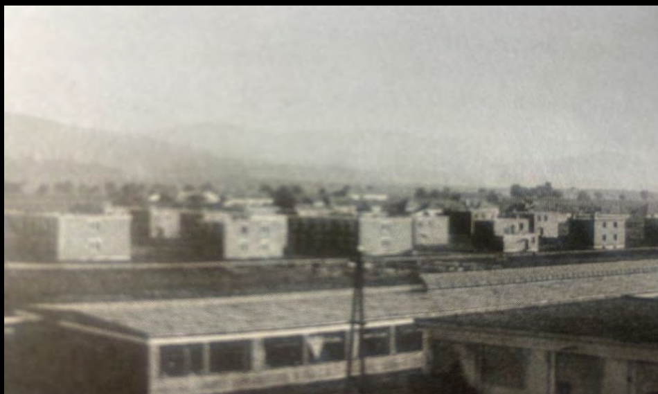
Červená kolónia Bošany