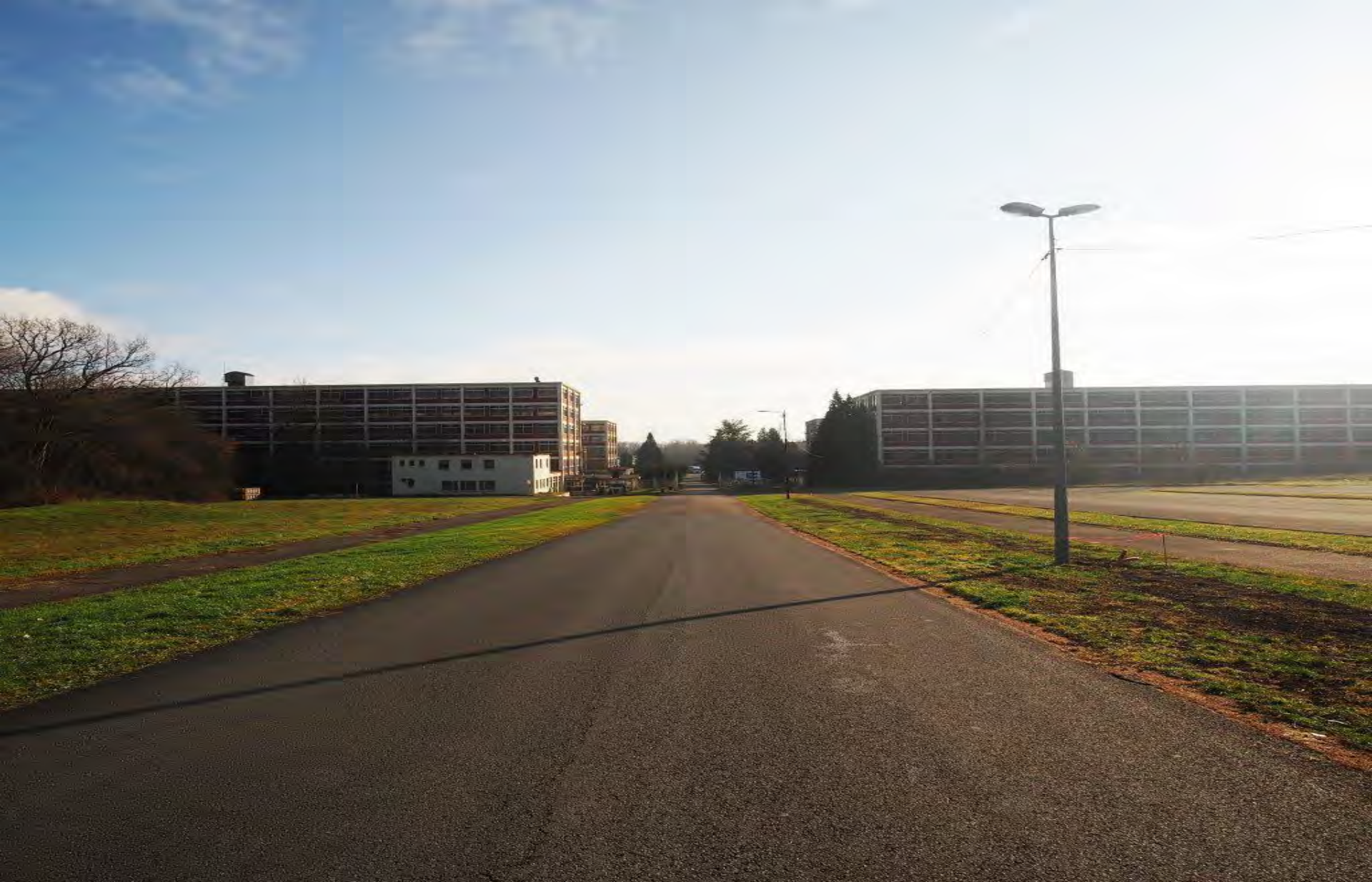
Hellocourt - Bataville Francúzska republika 1932 – 1936 pohl'ad na Bataville Hellocourt