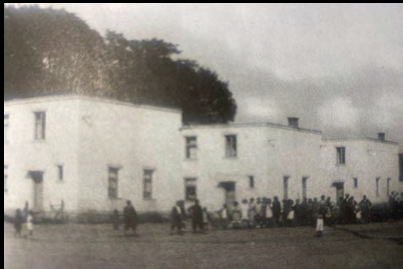
Biela kolónia Bošany